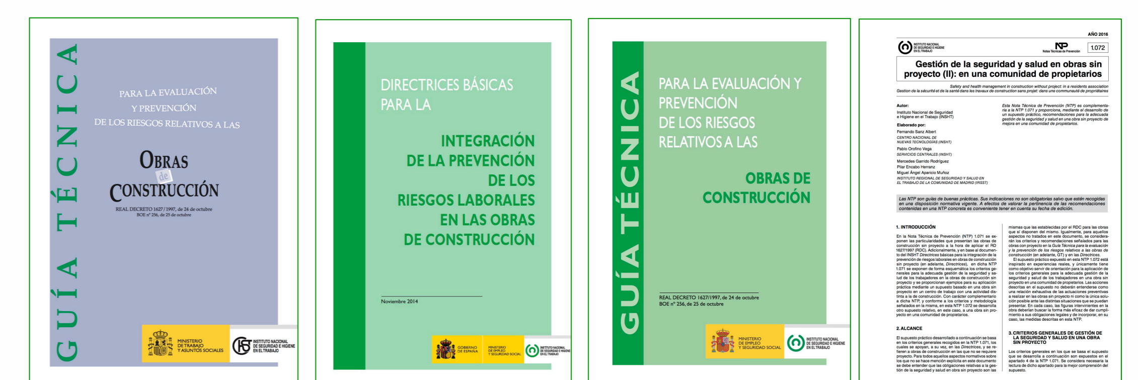
Guías Técnicas –Nota Técnica de Prevención. Instituto Nacional de Seguridad, Salud y Bienestar en el Trabajo. Ministerio de Empleo.