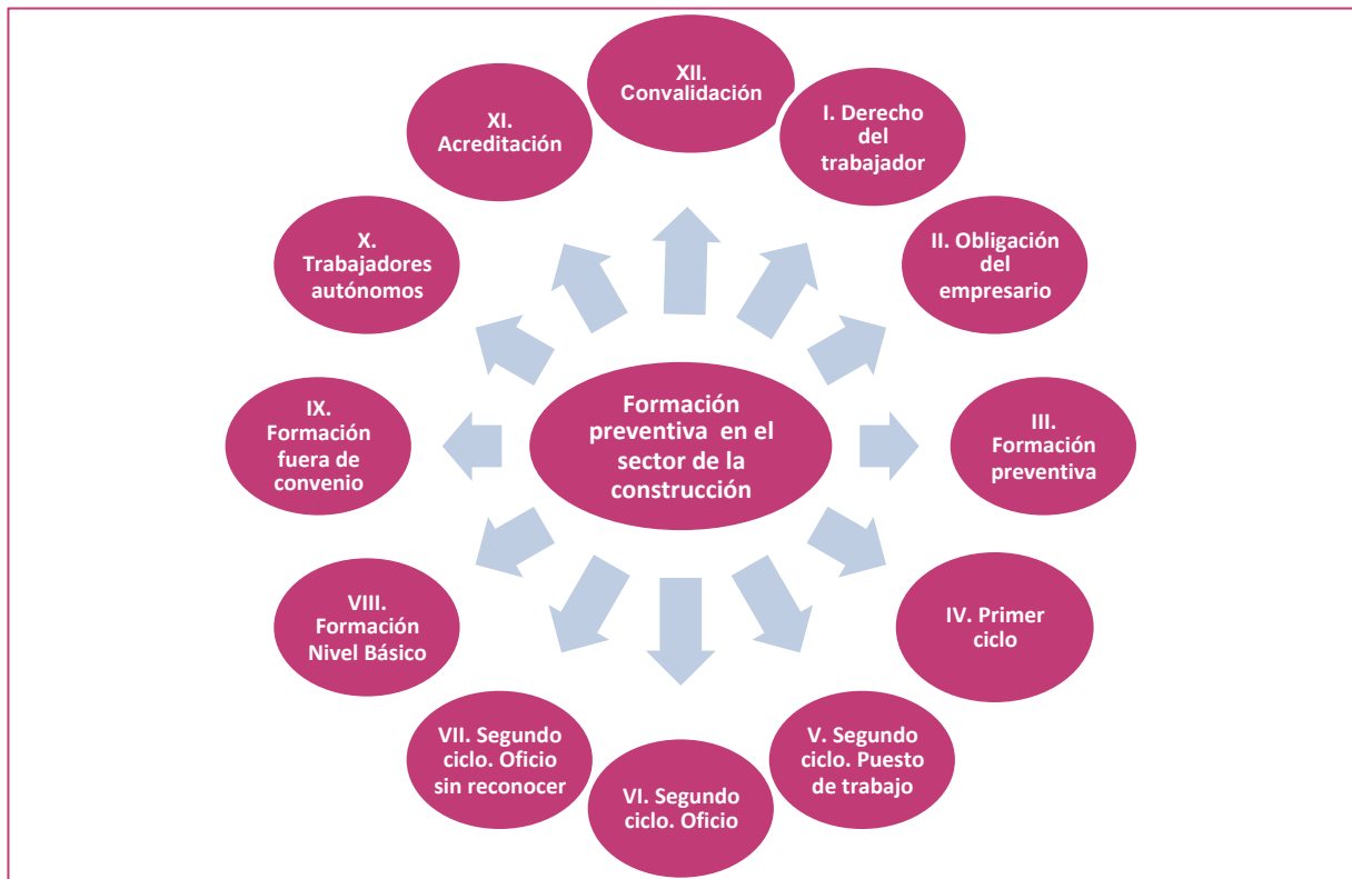
Figura 1. Flujograma Formación Preventiva en el sector de la construcción.