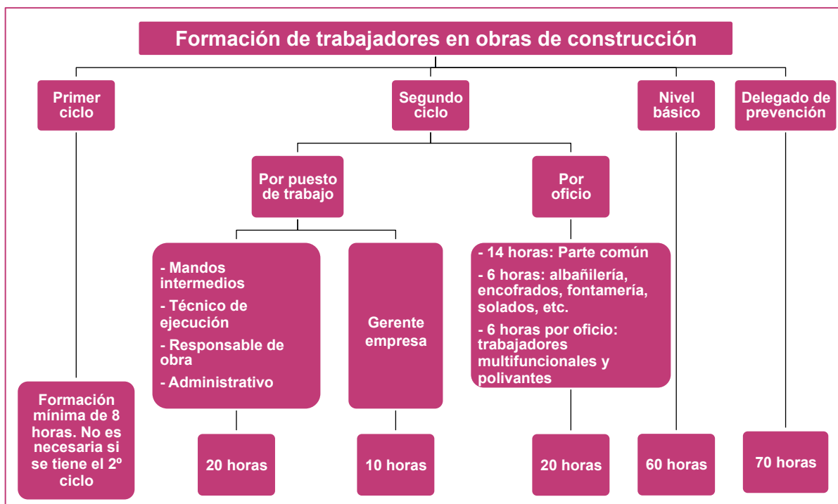
Figura 5. Esquema general de la formación en materia preventiva en el sector de la construcción.